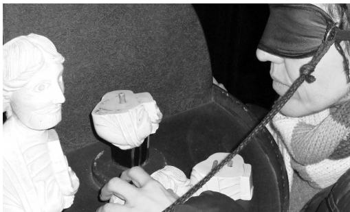
En la Casa de las Ciencias

Y es que la oferta cultural de nuestra ciudad es tan numerosa y variada que no podemos desaprovecharla. Equipo a la espalda, transitamos en febrero por escenarios muy diversos.