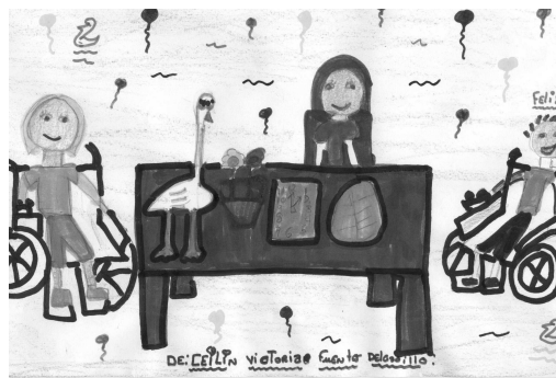
Victoria nos hizo un dibujo

Quien desee recibir “A diario” en formato digital, debe comunicarnos su dirección de correo electrónico.