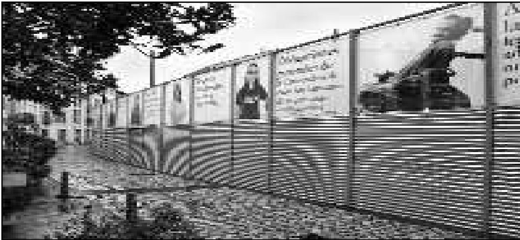
Se pueden ver en Ruavieja y Mercaderes

En la calle y bien visibles, hemos iniciado un año cargado de actividades, casi siempre propias, y a veces de otras entidades con las que colaboramos gustosos.